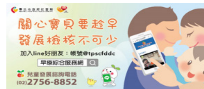
如圖二：早療綜合服務網 line@ 生活圈